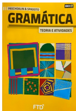
Gramática Teoria e Atividades Paschoalin e Spadoto Editora FTD