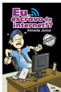
Eu, escravo da internet!? Almeida Júnior Editora Diversas