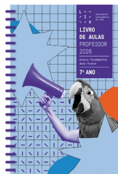
LIV - Laboratório Inteligência de Vida