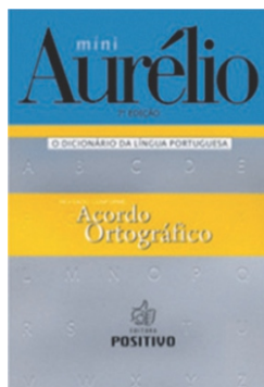
Mini Aurélio 7ª Edição O dicionário da Língua Portuguesa Edit. Positivo