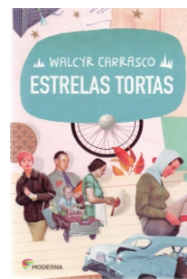
Estrelas Tortas Walcyr Carrasco Editora Moderna