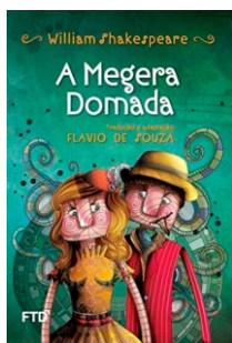
A Megera Domada William Shakespeare Editora FTD